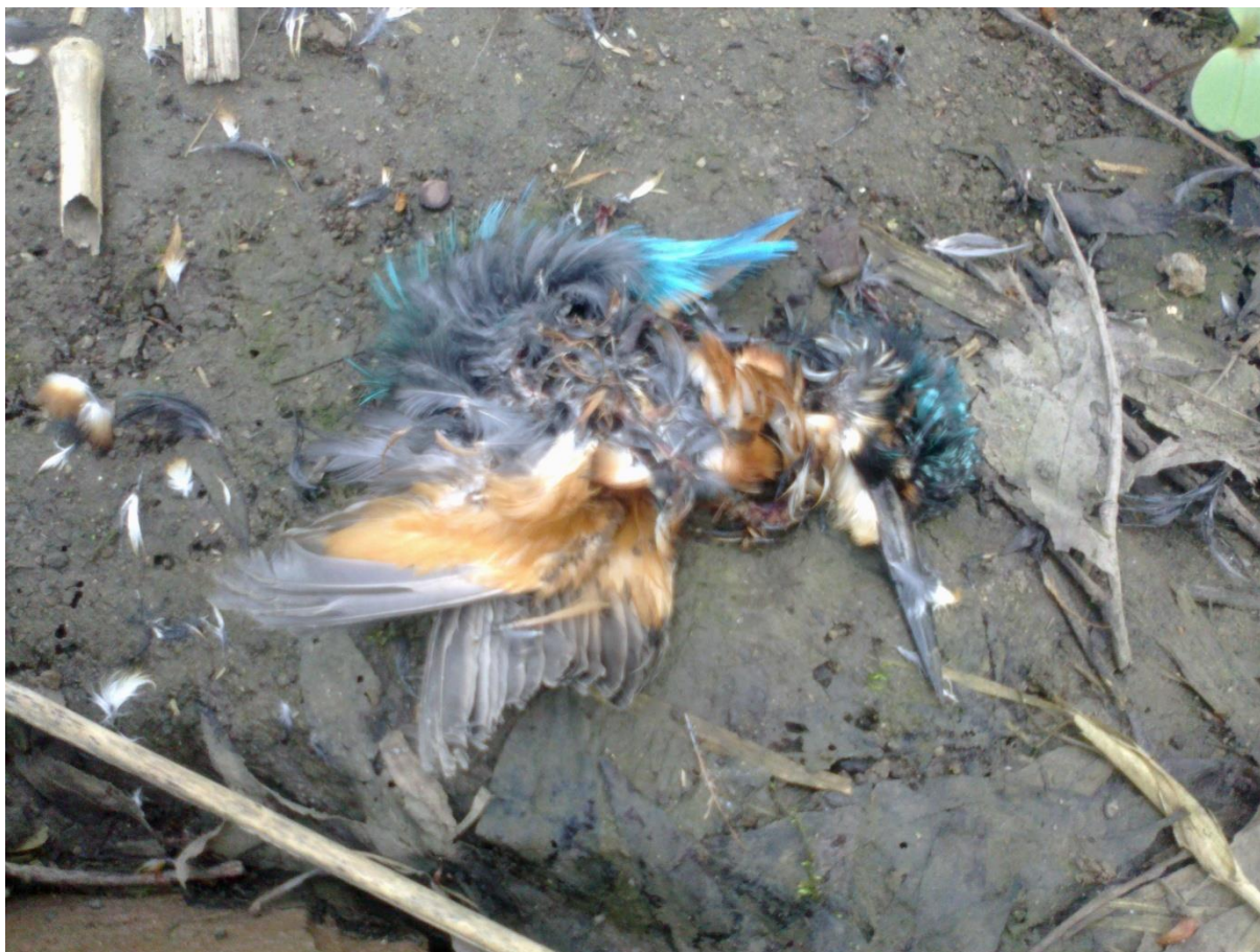
Het dode mannetje Ijsvogel