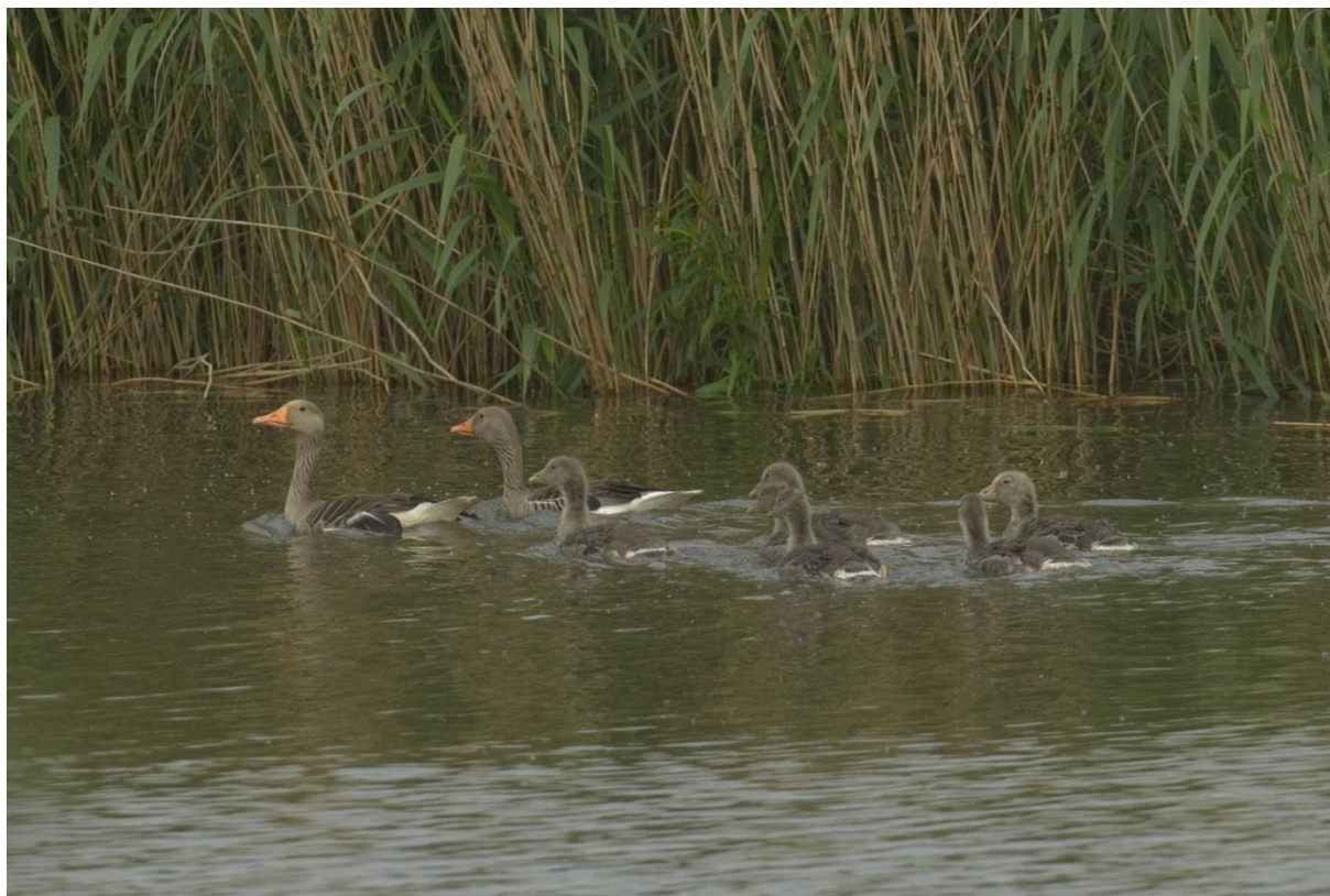
Grauwe ganzen met jongen

soepganzen en 2 paren Grote Canadese gans vastgesteld. We zijn benieuwd hoe de aantallen zich de komende jaren zullen ontwikkelen.