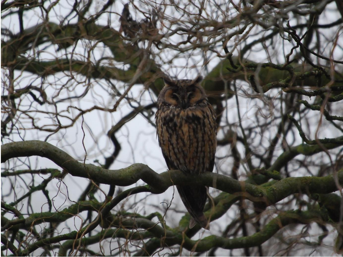
Eén van de drie ransuilen