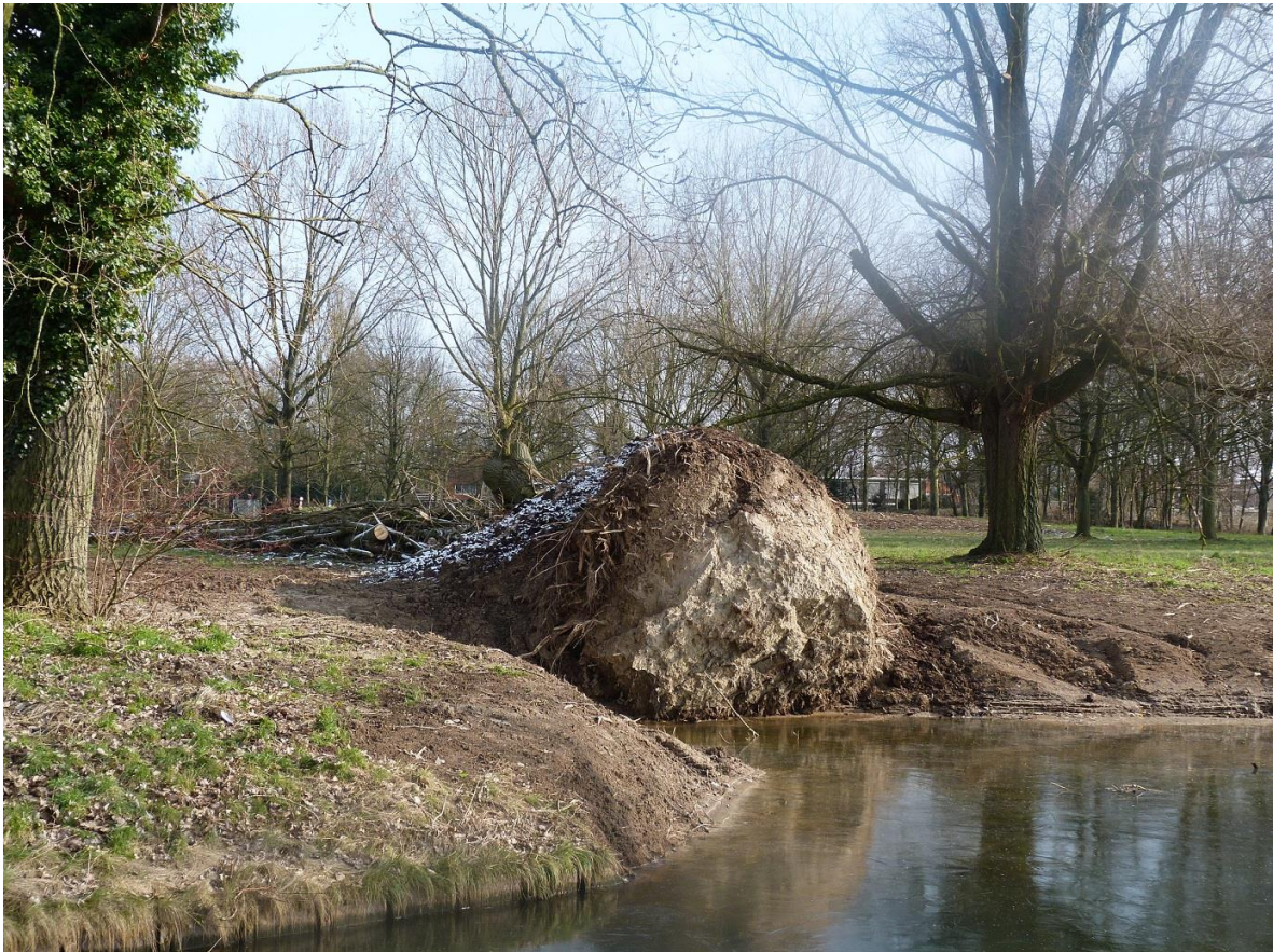
Nieuwe ijsvogelhuisvesting in het Overkamppark

Wie met de auto of de fiets over de Overkampweg rijdt, zal de 'omgevalen' boom met een