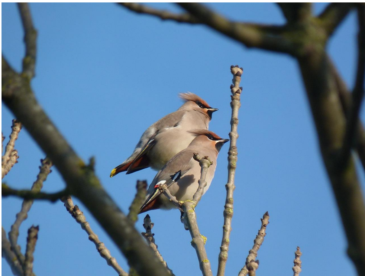
Pestvogels in de Kringlooptuin

Pestvogels zijn meestal niet schuw en omdat ze bessen eten van soorten als Gelderse roos, liguster en cotoneaster, verschijnen ze vooral in stedelijk gebied. De grootste groepen doken op in een woonwijk in Barendrecht (maximaal 83) en Vlissingen (100). Veel vogels verdwenen echter ook weer snel. Ook in onze regio verschenen op diverse plaatsen pestvogels, zoals in het recreatiegebied Crayenstein en in de wijken Sterrenburg en Het Reeland. Helaas bleven de vogels maar kort en zijn ze zeer waarschijnlijk spoedig zuidelijker getrokken.